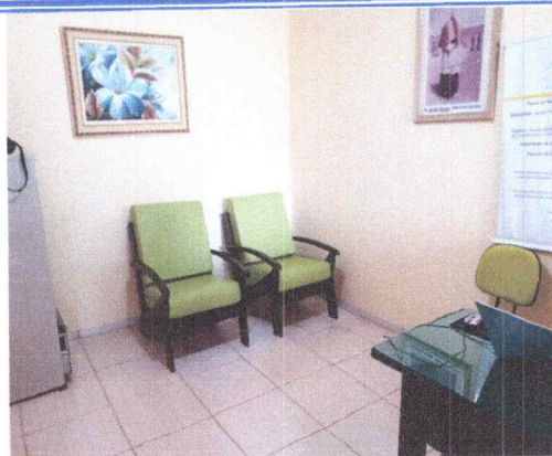
Sala de Serviço Social e Psicologia