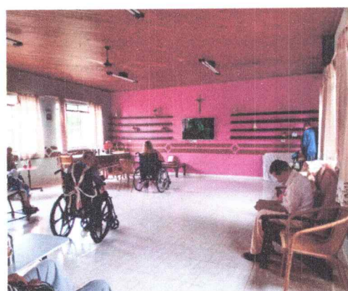
Salão de Convivência