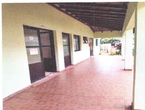
Lavanderia e Depósitos de limpeza